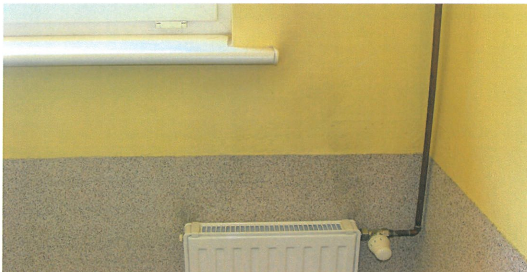
Fot.2. Widok klatki schodowej