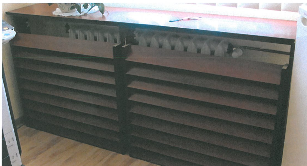
Fot.4. Osłony grzejnikowe