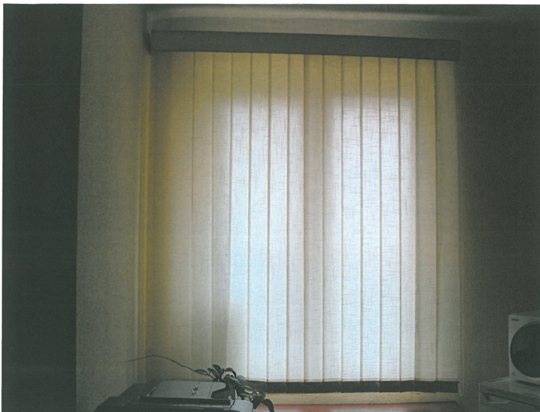
Fot.7. Widok istniejących rolet okiennych