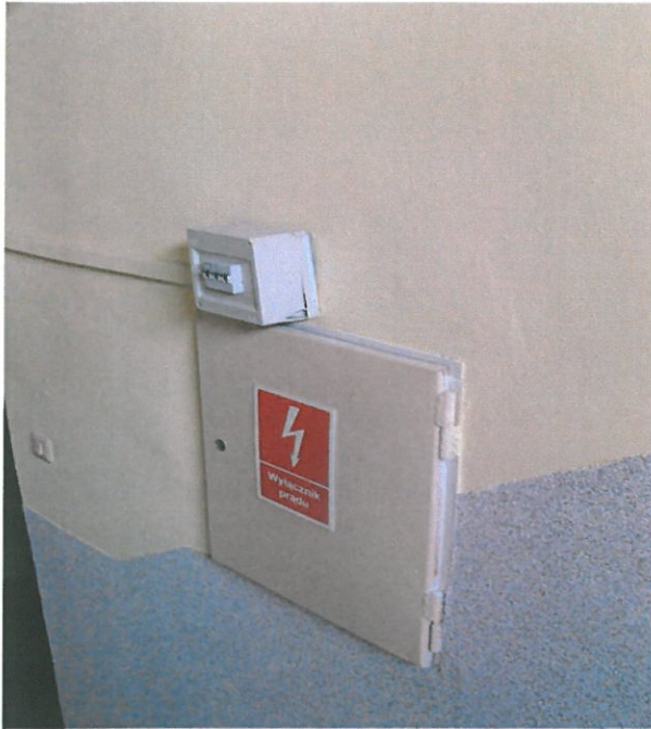
Fot.9. Ściany korytarza