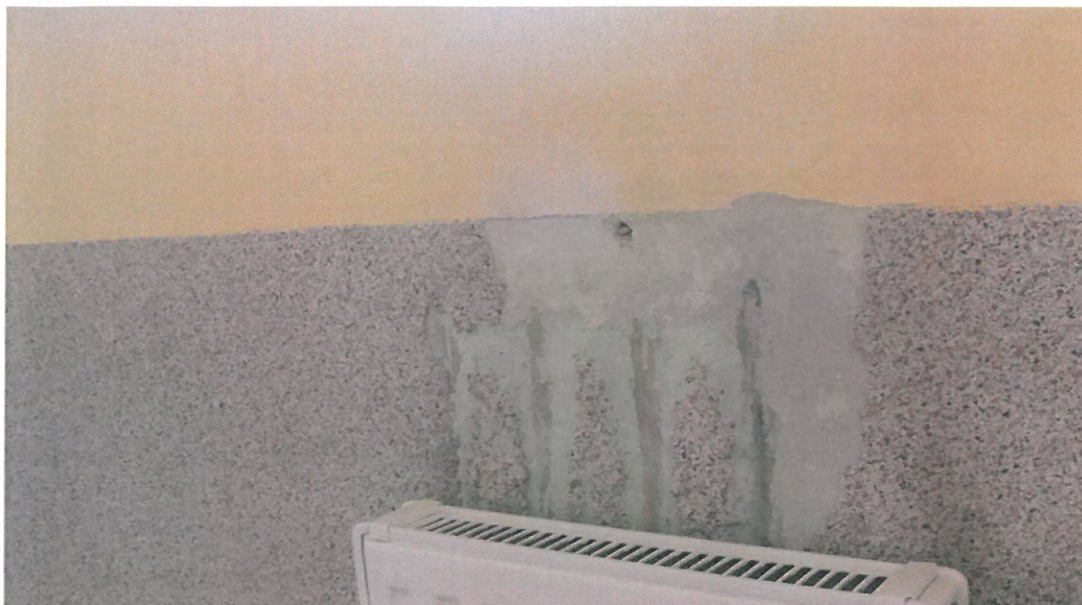
Fot.5. Ubytki mozaiki na korytarzu