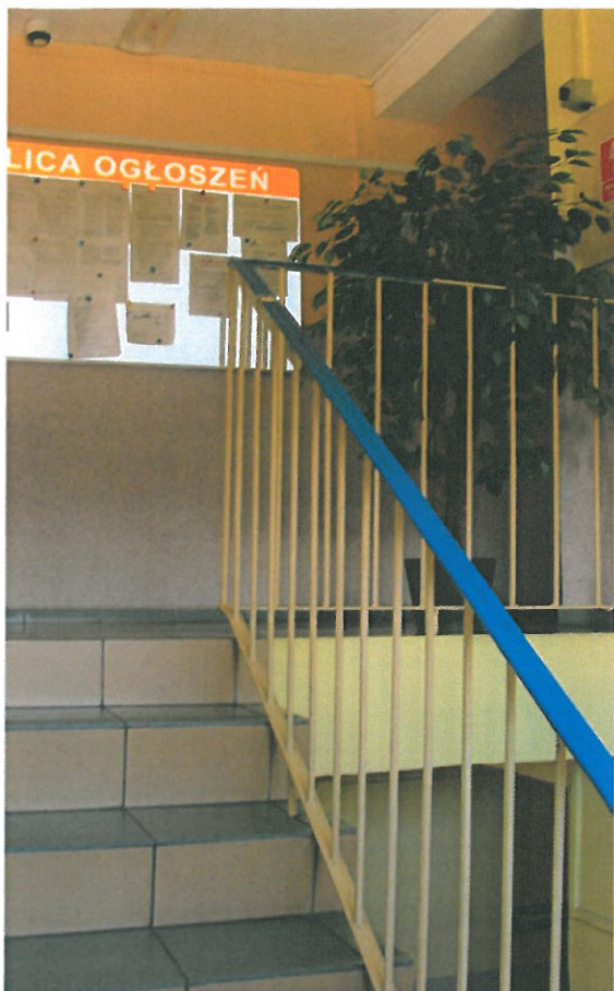
Fot.3. Balustrada schodowa