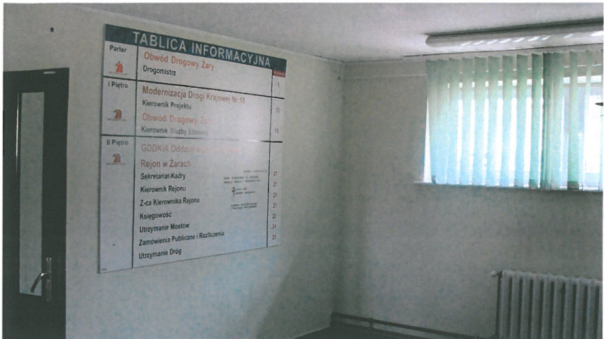
Fot.11. Korytarz parteru