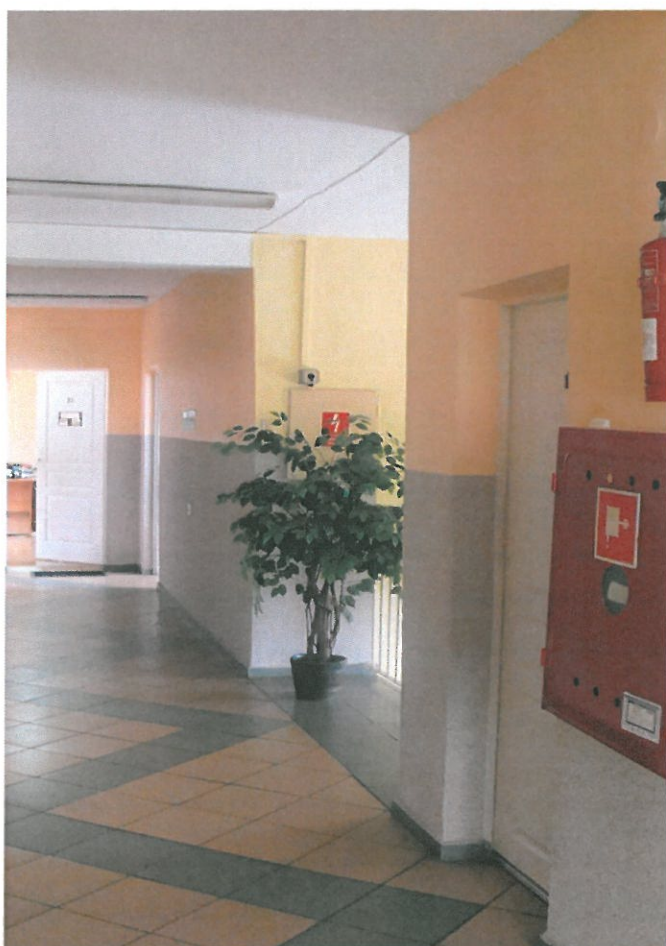
Fot.6. Widok korytarza