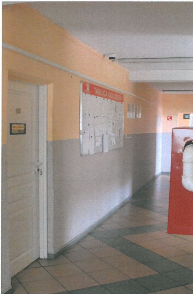
Fot.10. Widok korytarza