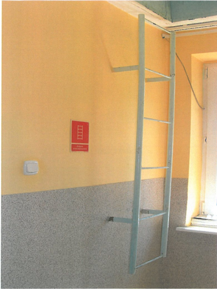
Fot.13. Widok korytarza