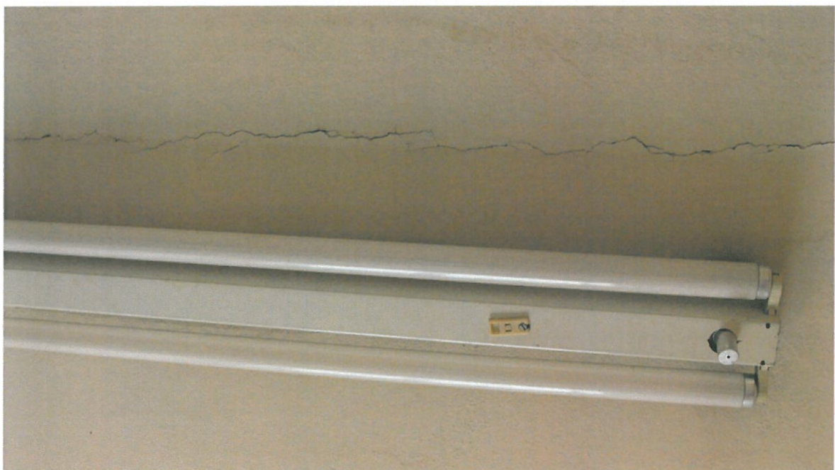
Fot.12. Sufit pomieszczeń biurowych